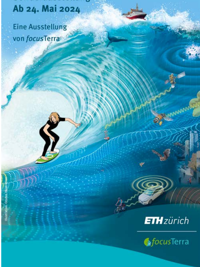
Illustration: Ocaïba Illustration