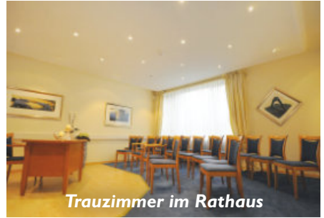
Trauzimmer im Rathaus