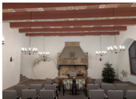
Trausaal im Rathaus