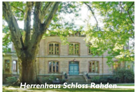
Herrenhaus Schloss Rahden