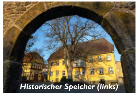
Historischer Speicher (links)