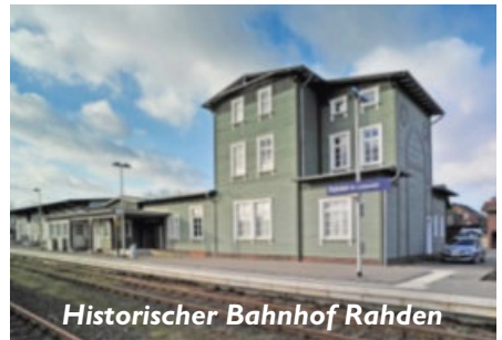
Historischer Bahnhof Rahden